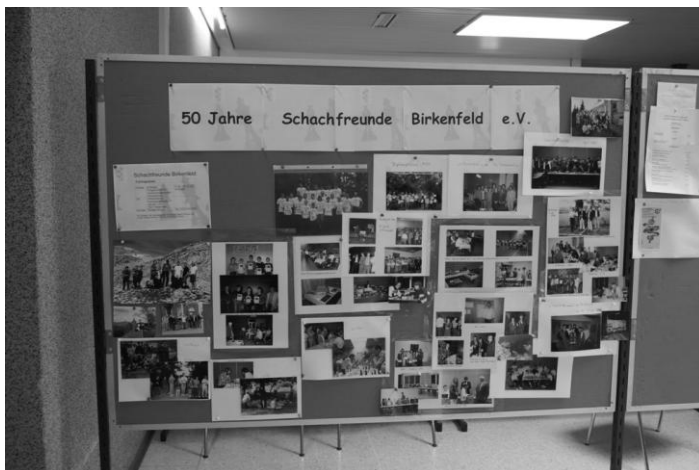
Informationsstand der SF Birkenfeld zum 50-jährigem Jubiläum